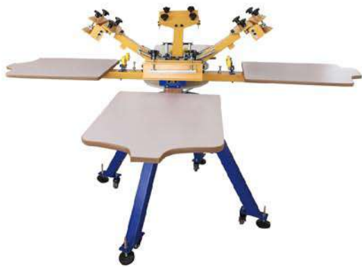
Simple type rotary machine 简易式印花机