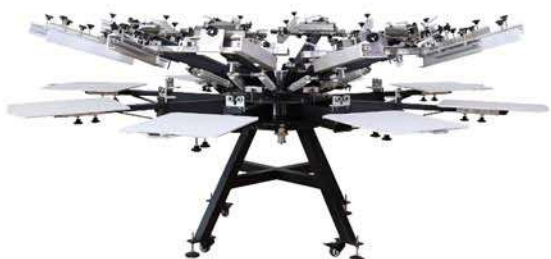
Double side clamp type rotary machine 双网夹印花机