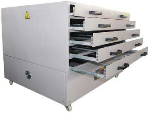
Drying cabinet 烘版箱