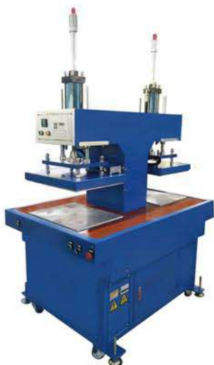
Double station embossing machine 双工位压花机