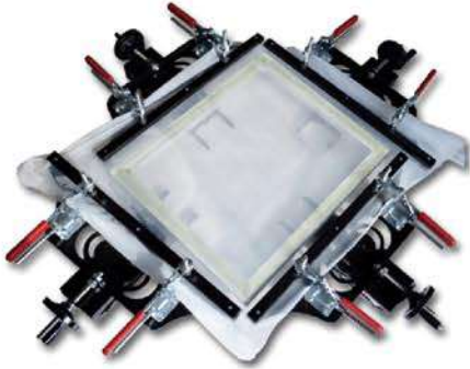
Manual stretcher 手动绷网器