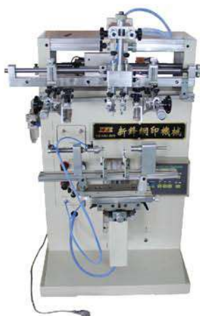
半自动曲面丝印机