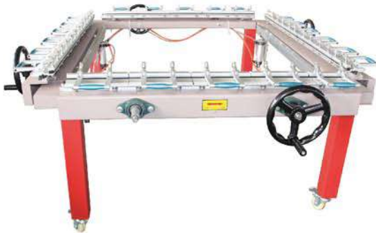
Double clamp stretch machine 双夹头拉网机