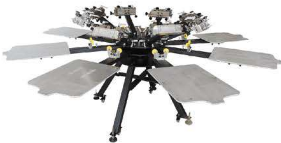
Aluminum table rotary machine 铝台板印花机