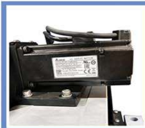
AC SERVO MOTOR