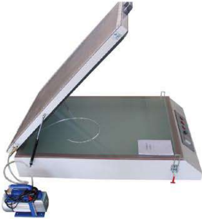
Cold light exposure unit 冷光源晒版机