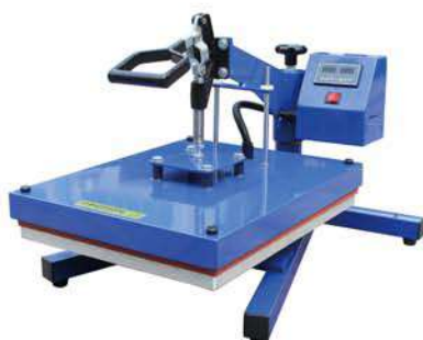
Swing head type heat press 摇头式烫画机