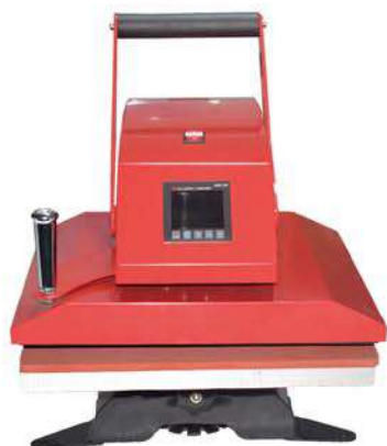
Swing head type heat press 摇头式烫画机