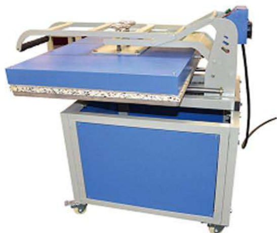
High pressure heat press 高压烫画机