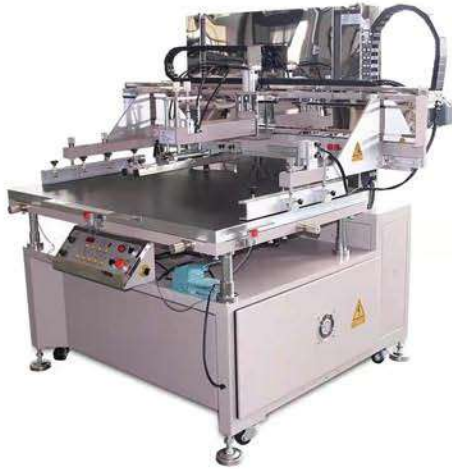
垂直升降式丝印机