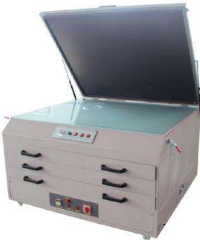
Cold light exposure drying cabinet 冷光源晒烘一体机