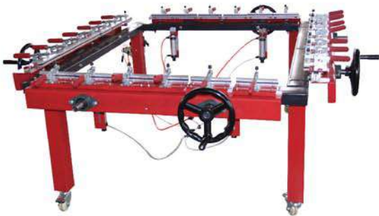
Single clamp stretch machine 单夹头拉网机