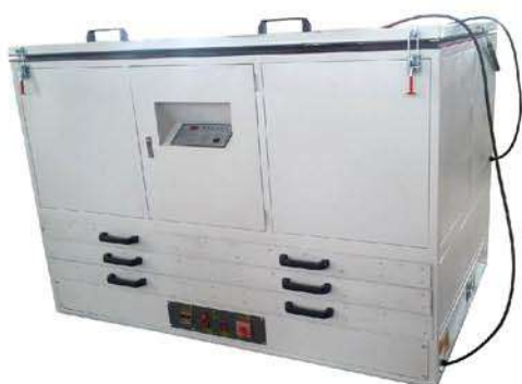
碘镓灯晒烘一体机