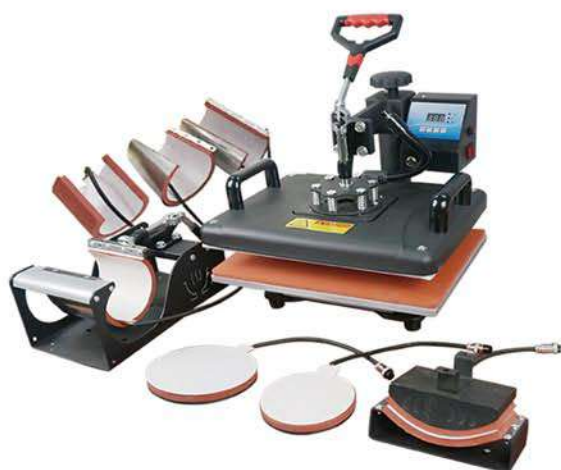
8 in1 heatpress 8合1烫画机