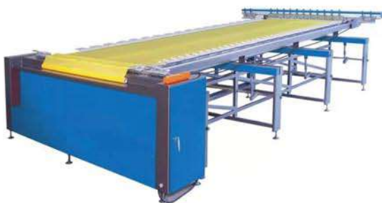
Electric stretch machine 电动拉网机